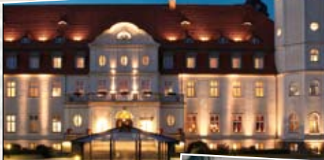
● Schloss Fleesensee

2010 wird unserer Reisefamilie ein niveauvolles und romantisches Weihnachtsarrangement geboten. Unser Firstklass-Wellness & Golfhotel Fleesensee liegt romantisch am See nahe Waren in der Mecklenburgischen Seenplatte. Gerade zur kühlen Jahreszeit erfreuen wir uns an der wohltuenden Wellnesserholung in einer der beeindruckendsten SPA & Wellnessanlage Deutschlands. Schenken Sie sich die schönsten Feiertage des Jahres in einem festlichen Rahmen mit besonderem Ambiente.