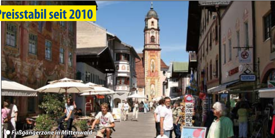
● Fußgängerzone in Mittenwald

Mittenwald liegt auf 912m Seehöhe, südlich von Garmisch und grenznah zu Tirol in einer idyllischen Naturlandschaft zwischen Bergen und Seen. In naher Umgebung finden wir hügelige Almböden mit blühenden Wiesen, Waldlehrpfade und mehrere Naturbadeseen. Die Karwendelbahn bringt uns auf 2.385 m Höhe, von wo wir einen einmaligen Panoramablick auf die umliegende Bergwelt genießen. Der malerische Ortskern zählt zu den schönsten Bayerns, mit seiner Lüftmalerei und den liebevoll verzierten Häuserfassaden. Mittenwald hat lange Tradition im Geigenbau mit eigenem Geigenbaumuseum.