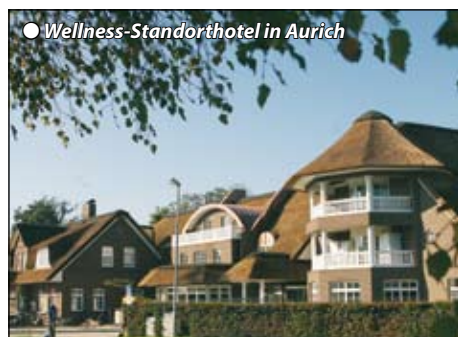
Wellness-Standorthotel in Aurich

Abfahrt Mittelbach 6 h über Chemnitz, Magdeburg und Hannover in die Seestadt Wilhelmshaven. Nachmittagsbummel, um einige der maritimen Sehenswürdigkeiten kennen zu lernen wie z.B. das Wattenmeerhaus, Strandpromenade oder Feuerschiff. Anschließend geht es über die Bierstadt Jever mit einem Schluck „Friesisch-Herbem“ nach Aurich/Ogenbargen. Bezug unseres vorzüglichen Standorthotels „Alte Post“ mit Biergarten, Lehmhütte, Wellnessoase, Schwimmbad, Sauna, Dampfbad. Abendessen/Übernachtung.