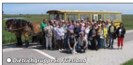
Diétrichgruppe in Friesland

Frühstücksbuffet, danach laden wir zum Friesland Entdeckungsausflug ein, wo uns eine Spezialführerin alles über Land und Leute erzählen wird. Zunächst geht's entlang der Ems zu einem Besuchsstop am Emssperrwerk, einem beeindruckenden Wunderwerk mit Außenbesichtigung. Nächste Station ist Emden mit Rundfahrt durch die Stadt und Hafenanlagen. Anschließend Landschaftsfahrt vorbei am Windpark Wybelsumer Polder, dem Rundwarfendorf Rysum und dem Pilsmer Leuchtturm entlang der Küste mit ihren Deichen und Schafherden durch die schönsten Sielorte. Mittagspause und Spaziergang im alten Fischerdorf Gretsiel. Entlang des Störtebecker Deichs und Polders geht es nach Norddeich wo wir die Seehund-Aufzuchtstation besuchen und die Tiere bei der Fütterung beobachten können. Einladung zum Kaffeetrinken mit Kuchen im Hotel. Anschließend versuchen wir uns im traditionsreichen „Bosseln“ mit Schnaps. Nach dem Abendessen findet ein geselliger Tanzabend statt, Übernachtung.