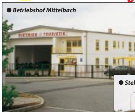
● Betriebshof Mittelbach