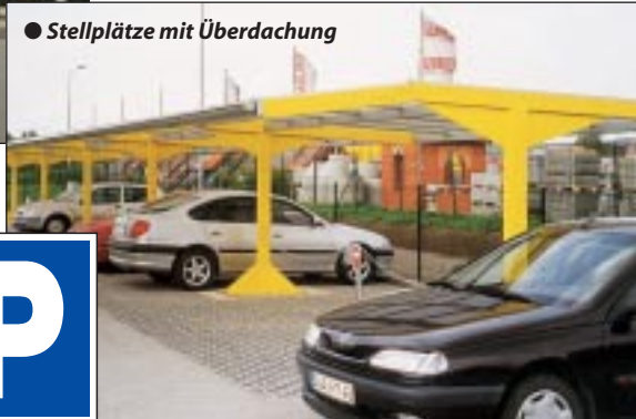
● Stellplätze mit Überdachung