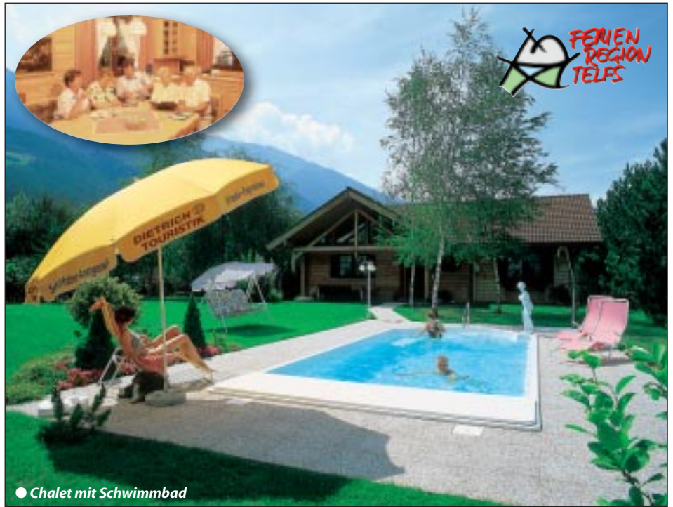
● Chalet mit Schwimmbad