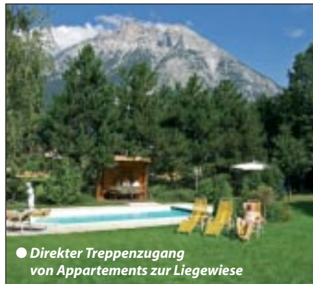
● Direkter Treppenzugang von Appartements zur Liegewiese