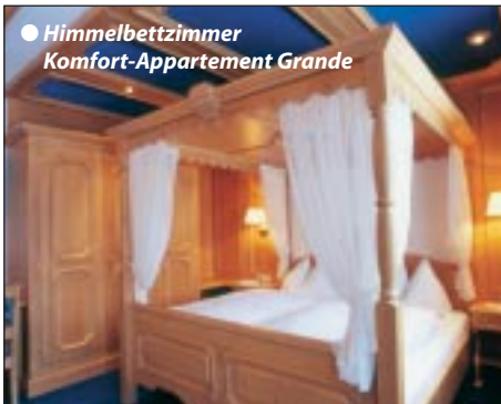
● Himmelbettzimmer Komfort-Appartement Grande

Für höchste Ansprüche - ideal für befreundete Ehepaare und Großfamilien (ca. 80 qm)! Großer Wohnraum mit Sitzgarnitur, 2 getrennte, elegant ausgestattete Schlafräume. Einer davon mit „Himmelbett“. Jedes Schlafzimmer ist mit einer Sitzcouch ausgestattet, welche bei Bedarf für Zusatzbetten verwendet werden kann. Vorraum, Westbalkon mit direktem Zugang zum Schwimmbad und Liegewiese; Großer Essplatz mit Eckbank, Farb-Sat-TV und Safe in jedem Zimmer, Schreibtisch, Kofferbock, Küchenblock mit Geschirrspüler, E-Herd, Mikrowelle und kompl. Besteck- Geschirrausstattung. Elegantes Badezimmer mit Komfortdusche/ Sitzbank, Haarfön, sep. WC; Direktwahl-Telefon, Stereoanlage, Videorecorder und Radiowecker. Lage: Obergeschoß Betriebsgebäude.