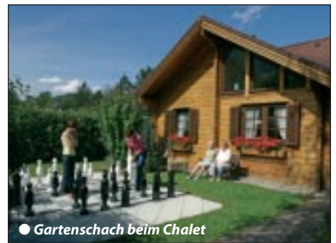
● Gartenschach beim Chalet

Großer Aufenthaltsraum mit Gästeküche, Geschirrspüler, Kühlschrank, Kaffeemaschine und Geschirr/Besteck pro Zimmer, 3 komfortable Wohneinheiten (1 Doppelbett + Zusatzbett) mit Dusche/WC, Fußbodenheizung, rustikale Holzeinrichtung, Telefon, Kabel-Farb-TV, Radiowecker, Safe und Haarfön. Das Frühstück können Sie selbst zubereiten und auch im Freien einnehmen.