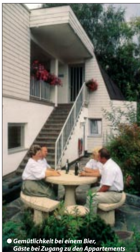
● Gemütlichkeit bei einem Bier, Gäste bei Zugang zu den Appartements