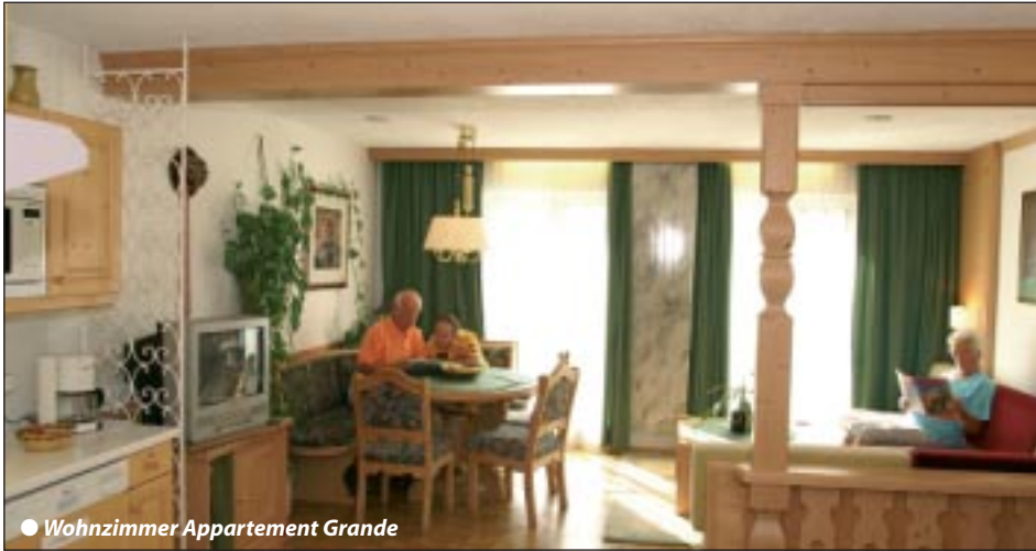
● Wohnzimmer Appartement Grande