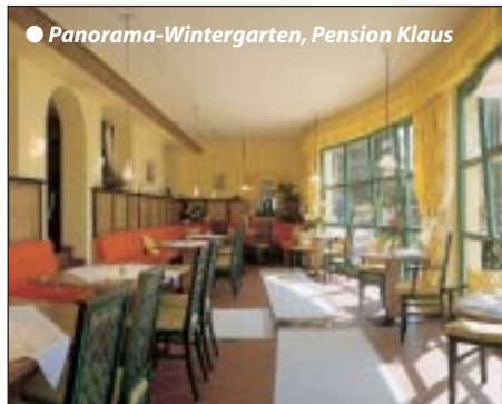
● Panorama-Wintergarten, Pension Klaus

Buchbar 31.5. - 12.10.08. Ruhige und zentrale Lage am Waldrand mit herrlichem Panoramablick auf die umliegende Bergwelt und das Inntal. Gediegenes Haus mit liebevoller Ausstattung. Große Sonnenterrasse, gemütliche Aufenthaltsräume, freundlicher Frühstücksraum, Kinderspielecke, Liegewiese. Eigener Hotelparkplatz (Garage auf Anfrage).