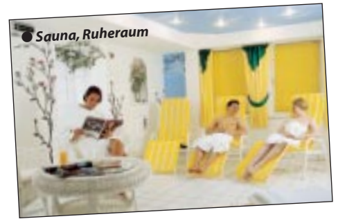
● Sauna, Ruheraum