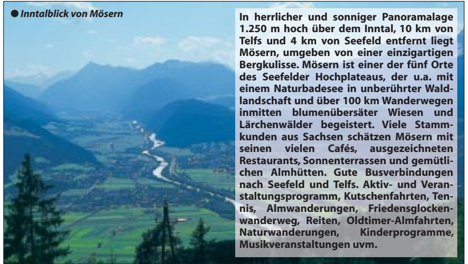
● Inntalblick von Mösern

In herrlicher und sonniger Panoramalage 1.250 m hoch über dem Inntal, 10 km von Telfs und 4 km von Seefeld entfernt liegt Mösern, umgeben von einer einzigartigen Bergkulisse. Mösern ist einer der fünf Orte des Seefelder Hochplateaus, der u.a. mit einem Naturbadeseen in unberührter Waldlandschaft und über 100 km Wanderwegen inmitten blumenübersäter Wiesen und Lärchenwälder begeistert. Viele Stammkunden aus Sachsen schätzen Mösern mit seinen vielen Cafés, ausgezeichneten Restaurants, Sonnenterrassen und gemütlichen Almhütten. Gute Busverbindungen nach Seefeld und Telfs. Aktiv- und Veranstaltungsprogramm, Kutschenfahrten, Tennis, Almwanderungen, Friedensglockenwanderweg, Reiten, Oldtimer-Almfahrten, Naturwanderungen, Kinderprogramme, Musikveranstaltungen uvm.