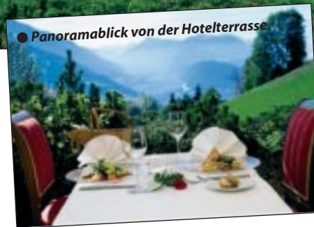
● Panoramablick von der Hotelterrasse