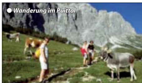
● Wanderung im Puittal

KINDERERMÄSSIGUNG GRATIS bis 4 Jahre, 30 % 5 - 10 Jahre im Elternzimmer und für Einzelreisende mit Kind