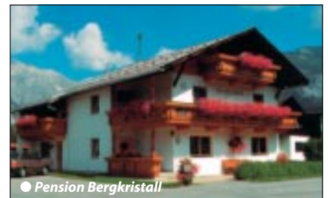
● Pension Bergkristall

Buchbar 17.5. - 15.10.08. Gemütliche, einfachere Frühstückspension in sonniger und zentrumsnaher Lage am Wiesenrand, im Ferienort Weidach. Gepflegte, liebevolle Ausstattung: Frühstücksraum mit Gästekühlschrank, Kaffeemaschine und Teekocher, große Sonnenterrasse, Liegewiese mit Liegestühlen, PKW-Parkplätze für Selbstfahrer. Nette, zweckmäßige Zimmereinrichtung mit Dusche/WC, Sat-TV und teilweise Balkon. In der nächsten Umgebung gibt es günstige Restaurants, um die Mahlzeiten einzunehmen.