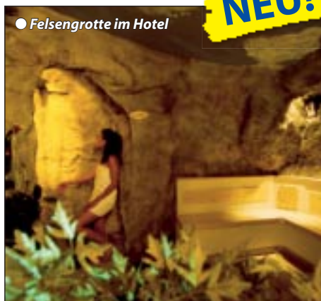
● Felsengrotte im Hotel

Buchbar 17.5. - 12.10.08. Gemütliches Urlaubshotel in ruhiger Lage, eingebettet zwischen Wiesen und Wäldern, im Ortsteil Weidach, dem Zentrum des Leutaschtales. Das familiär geführte Haus verfügt über eine traditionelle Ausstattung mit Reception, Personenlift, Hotelbar, gemütlichem Aufenthaltsraum, Frühstücksraum, großzügigem Speisesaal, Sonnenterrasse, großem Garten mit Liegewiese und Kinderspielplatz. Autoparkplätze am Haus.