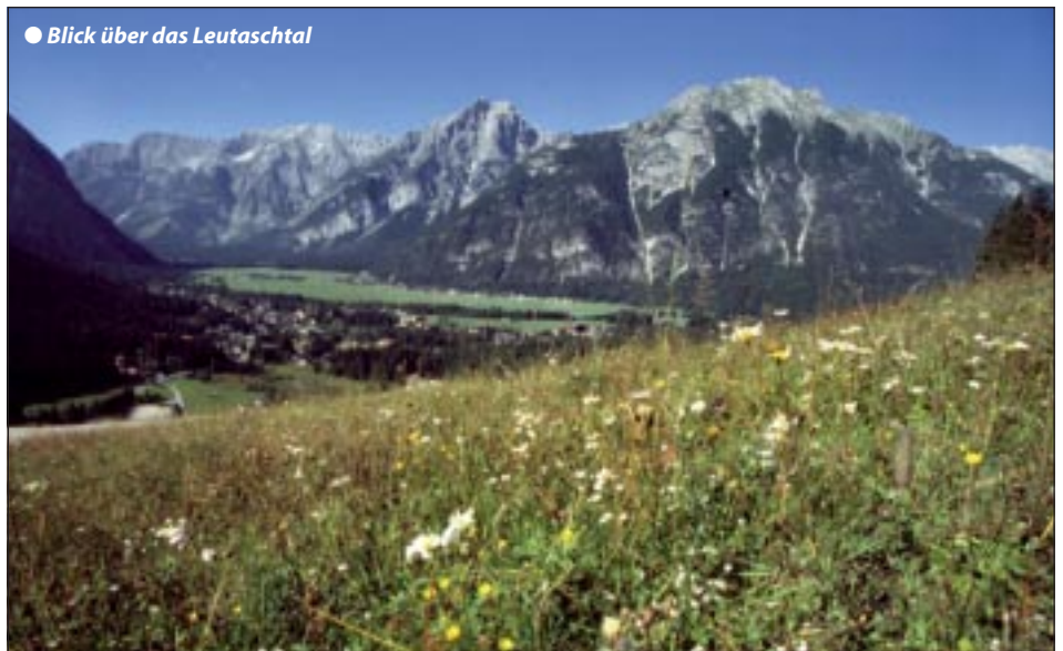
● Blick über das Leutaschtal

Hotelangebot, Wanderprogramm mit geprüften Bergwanderführer: Tageswanderung auf Hochalmen/ Hütten € 10,-, Gipfeltouren € 12,-, Zweitagestour € 60,- inkl. Bergführer, Hüttenübernachtung im Lager mit Frühstück, Lunchpaket für unterwegs sowie allf. Transfer (Preise p.P.).