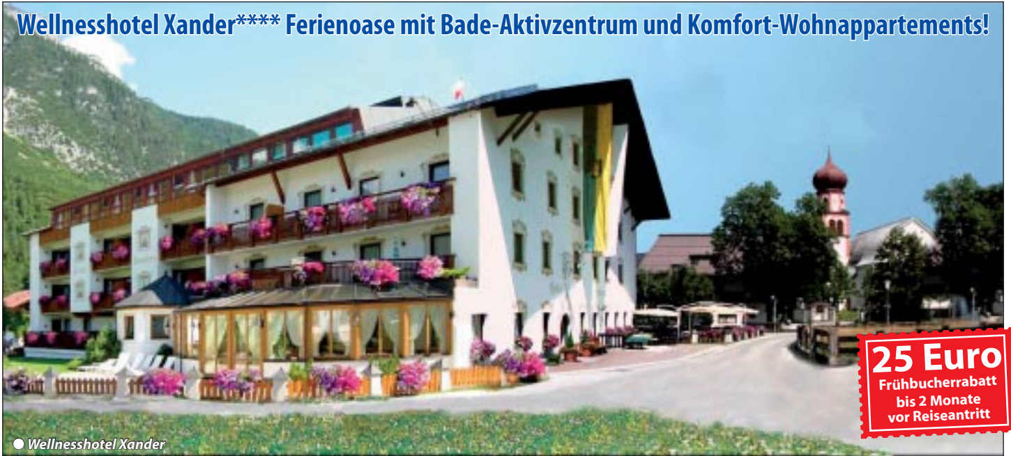
● Wellnesshotel Xander

25 Euro Frühbucherrabatt bis 2 Monate vor Reiseantritt