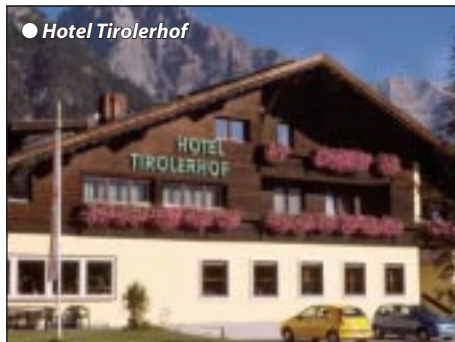
● Hotel Tirolerhof

Buchbar 17.5. - 12.10.08. Gemütliches Urlaubshotel in ruhiger Lage, eingebettet zwischen Wiesen und Wäldern, im Ortsteil Weidach, dem Zentrum des Leutaschtales. Das familiär geführte Haus verfügt über eine traditionelle Ausstattung mit Reception, Personenlift, Hotelbar, gemütlichem Aufenthaltsraum, Frühstücksraum, großzügigem Speisesaal, Sonnenterrasse, großem Garten mit Liegewiese und Kinderspielplatz. Autoparkplätze am Haus.