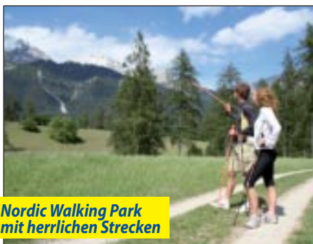
Nordic Walking Park mit herrlichen Strecken

KINDERERMÄSSIGUNG GRATIS bis 8 Jahre, 50 % 9 - 11 Jahre, 30 % von 12 - 15 Jahre im Elternzimmer und für Einzelreisende mit Kind