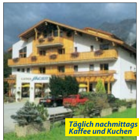
Täglich nachmittags Kaffee und Kuchen

Buchbar 17.5. - 12.10.08. Gemütliches Landhotel in schöner Lage inmitten des Hauptdrehortes der Filmserie „Der Bergdoktor“. Das familiär geführte Haus verfügt über eine gehobene Ausstattung: Niveauvolle Hotelhalle mit Reception, Hausbar, Restaurant, uriges Zirbenstüberl, Speisesaal mit Kachelofen, Aufenthaltsraum mit TV, Personenlift, Kinderspielplatz, Sonnenterrasse und Liegewiese, schattiger Biergarten, Hotelparkplatz für PKW. Großzügiger Wellnessbereich mit Sauna, Dampfbad, Sanarium und beheiztem Freischwimmbad - alles kostenlos benutzbar . Frühstücksbuffet mit Bioecke, mehrgängiges Abendmenü. Kuchenbuffet mit Kaffee , Tee und Kakao am Nachmittag.