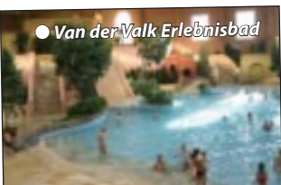
● Van der Valk Erlebnisbad

Parkanlage mit 70ha und 200 überwiegend Reet gedeckten Landhäusern, ausgestattet mit gemeinsamer Küche und Aufenthaltsraum sowie separat abschließbare Schlafzimmer mit eigenem Bad/WC.