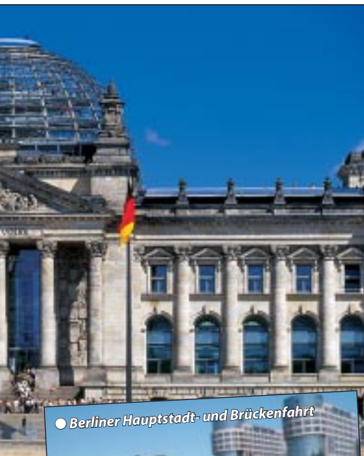
● Berliner Hauptstadt- und Brückenfahrt

punkten in 2 Tagen inklusive Berliner Brückenkreuzfahrt