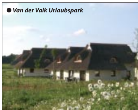
● Van der Valk Urlaubspark

Neu und günstig: Urlaubspark Van der Valk Linstow mit Erlebnisbaden und romantischem Landhausleben