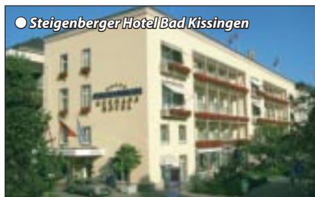
● Steigenberger Hotel Bad Kissingen