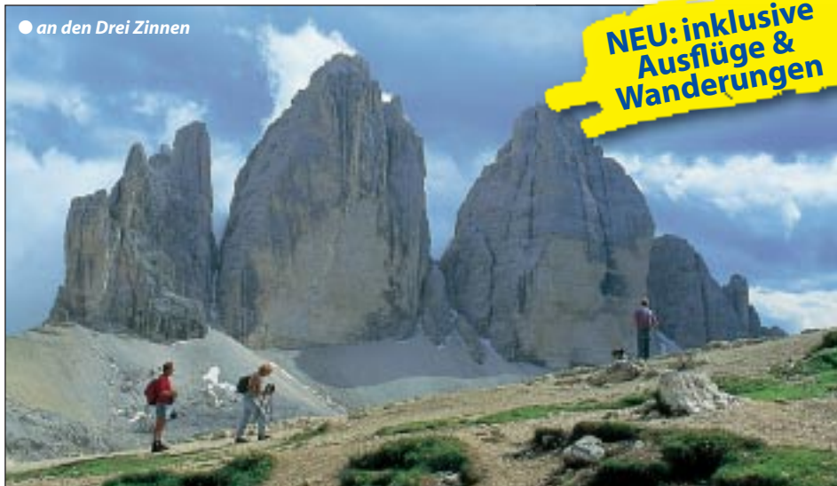
● an den Drei Zinnen

Erlebnisurlaub in der Südtiroler Bergwelt mit Standorthotel im Panoramaort Meransen Inklusive Ausflüge mit leichten Wanderungen Dolomiten, Kalterersee und Seiseralm