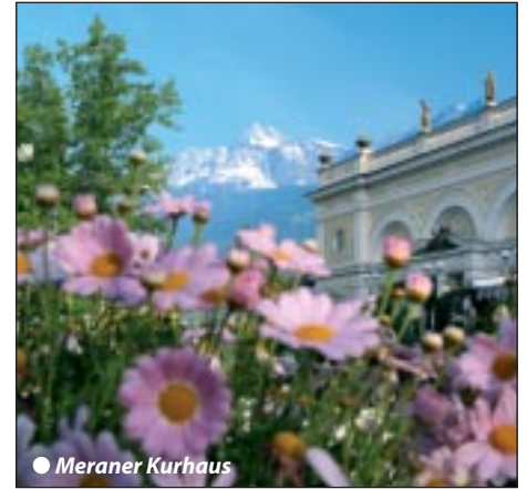
● Meraner Kurhaus

Besonders angenehm ist das komfortable Standorthotel mit Hallenbad im Panoramaort Meransen im Pustertal, wo wir die restlichen Freizeittage die Bergwelt „auf eigene Faust“ genießen können.