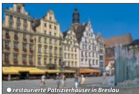
● restaurierte Patrizierhäuser in Breslau

Frühstück, danach Innenstadtfahrt und halbtägige Stadtbesichtigung mit Spezialführer. Es erwarten uns unzählige Sehenswürdigkeiten und Backsteingotik deutschen Ursprungs. Wir besuchen den Marktplatz mit dem Rathaus und Häu-