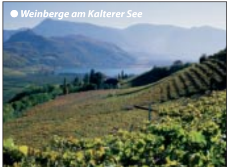
● Weinberge am Kalterer See

3. Tag: Weinstraßenausflug, Meran & Wanderung Frühstücksbuffet, Inklusivausflug mit Wanderführer zu den wärmsten Alpenseen. Zunächst besuchen wir die Kurstadt Meran mit Promenadenspaziergang und Stadtführung. Nächste Station ist der Montigglersee, wo wir etwa eine Stunde durchs herrliche Frühlingstal zum Kalterer See wandern. Über die Weindörfer im Bozner Unterland geht es zurück ins Hotel nach Meransen, wo uns heute ein Galadiner erwartet.