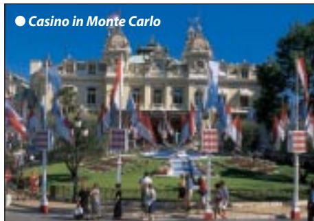
● Casino in Monte Carlo

TIPP Verlängerungs-oder Anschlussurlaub in Tirol zum begünstigten Selbstfahrertarif möglich, Rückfahrt sonntags 1 Woche später.