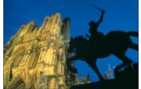
● Kathedrale in Reims

Frühstück, danach verlassen wir Frankreich und kommen wieder ins Saarland. In angenehmen Etappen geht es vorbei an Heidelberg nach Ansbach/Nürnberg. Nach einer allfälligen Umstiegs-pause mit kleinem Unterwegssnack fahren wir wieder zurück nach Sachsen, eine eindrucksvolle Erlebnisreise mit Kunst und Kultureindrücken geht zu Ende.