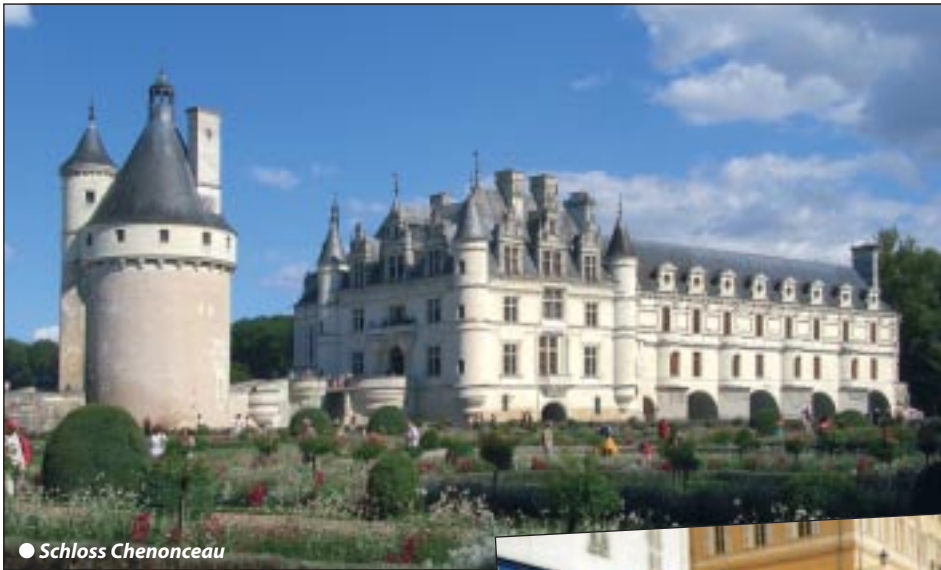
● Schloss Chenonceau

Faszinierende Frankreich Rundreise zu den herrlichsten Schlössern und Natur im Loiretal Höhepunkte: Seine metropole Paris, Burgund, Champagne, Kathedralen und Schlösser