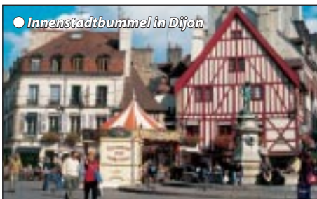
● Innenstadtbummel in Dijon

1. und 2. Tag: Sachsen - Tirol - Dijon/Burgund Abfahrt 8 h Chemnitz mit weiteren Zusteigestellen über Bayern ins Bergland Tirol. Nachmittagsfreizeit, Abendessen und Zwischenübernachtung in der Ferienregion Telfs/Imst. Am nächsten Morgen geht es ausgeruht auf herrlicher Alpenroute durch die Schweiz vorbei am Walen- und Zürichsee. Bei Basel kommen wir nach Frankreich und besuchen als erstes Belfort, die alte Festungsstadt am Eingang der burgundischen Pforte. Tagesziel ist Dijon, die Burgunderhauptstadt am Fuße der Hügelkette Côte d'Or. Bezug unseres zentrumsnahen Hotels mit Möglichkeit zum eigenen Stadtspaziergang. Abendessen/Übernachtung.