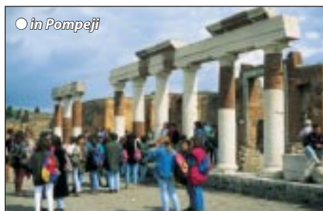
○ in Pompeji

Frühstücksbuffet, danach geht es mit dem Bus nach Pozzuoli bei Neapel, danach Schiffsüberfahrt auf die weltbekannte Thermeninsel Ischia. Bei der Panoramarundfahrt mit einem örtlichen Bus entdecken wir all die unvergesslichen Insel Schönheiten mit ihren Aussichtspunkten. Besonders reizvoll ist das Fischerdorf St. Angelo mit seinen pastellfarbenen Häusern und der Hafencbucht. Rückfahrt mit Boot und Bus ins Hotel, Halbpension/ Übernachtung.