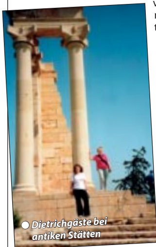
● Dietrichgäste bei antiken Stätten

Gepflegte Hotelanlage am Ortsrand und etwa 8 km von Larnaca entfernt, schöne Lage direkt am flach abfallenden Sandstrand und mit großem Palmengarten. Großzügige Schwimmbadanlage mit Hallenbad, Sonnenterrasse und Poolbar, Liegen und Sonnenschirme am Strand und am Pool, große Empfangshalle, Lifts, Restaurants mit Nichtraucherbereich und Frühstück sowie Abendessen vom Buffet, Cafeteria, Souvenirshops, teilweise saisonales Unterhaltungsprogramm. Komfortable Zimmer mit Telefon, Minibar, Mietsafe, Kabel-TV, Klimaanlage, Föhn, Bad/Dusche, WC und Balkon mit seitlichem Meerblick.