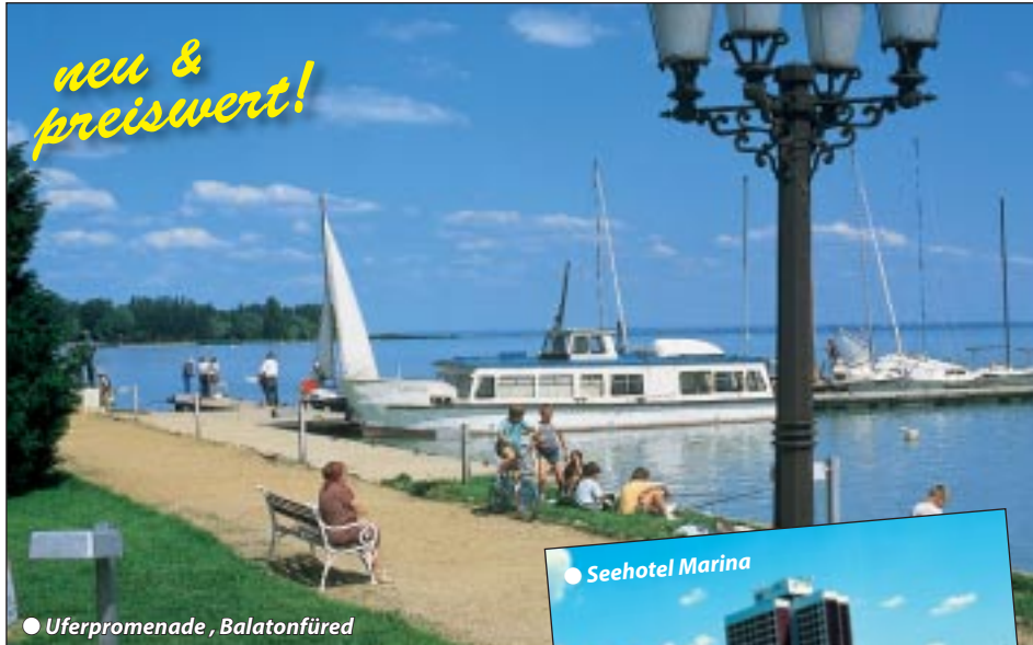
● Uferpromenade, Balatonfüred

8 Tage Preishit nur € 469,- **** allen Inklusivleistungen und beq