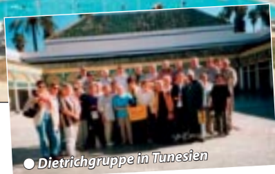
● Dietrichgruppe in Tunesien