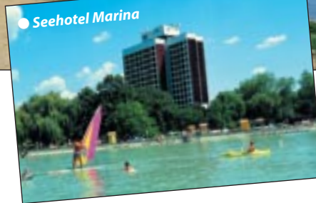
● Seehotel Marina

7 - 11 h: Reichhaltiges Buffetfrühstück 11 - 18 h: Speisen, Snacks, Palatschinken, Wurst, Makkaroni, Pommes, Pizza, Nudeln, Toast, Sandwiches 18 - 22 h: Abendessen Buffet mit Diätdecke 7 - 24 h: Softdrinks, Kaffee, Tee 11 - 23 h: Tafelweine, Bier vom Fass, 17 - 23 h: lokale alkoholische Getränke,