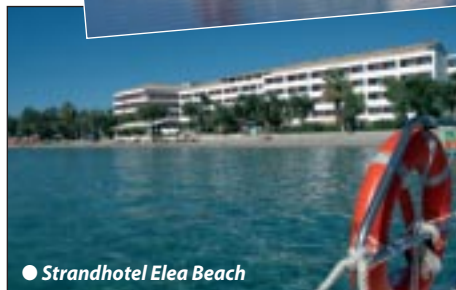
● Strandhotel Elea Beach