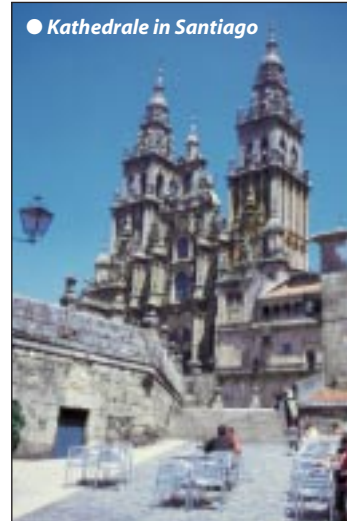
● Kathedrale in Santiago

Frühstück und Vormittagsfreizeit in Santiago de Compostela. Am frühen Nachmittag fahren wir zum nahegelegenen Flughafen, wo wir gegen 17 h mit Air Berlin den Rückflug nach München mit kurzer Zwischenlandung auf Mallorca antreten. Ankunft München gegen 22.30 h mit Übernachtung im Raum München (ohne Abendessen). Am nächsten Morgen Busrückfahrt nach Sachsen, wo wir gegen mittags am 12. Tag eintreffen.