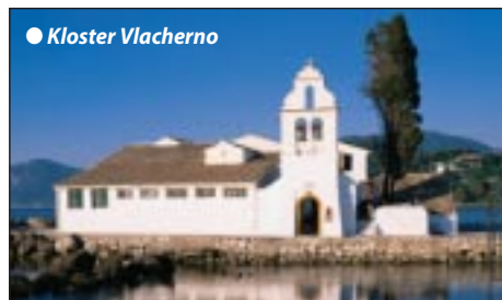
● Kloster Vlacherno

1. und 2. Tag: Sachsen - Venedig - Einschiffung Abfahrt 4.30 h früh mit unserem Transferbus über Hof, München nach Tirol. Weiter über den Brenner und Südtirol an den Gardasee (Aufenthalt). Zwischenübernachtung mit Abendessen am Gardasee oder Raum Verona. Ausgeruht geht es am nächsten Morgen nach dem Frühstück nach Venedig, wo wir an Bord unserer Komfortfähre gehen, die gegen 14 h nach Griechenland ausläuft. Bezug unserer Komfortkabinen mit Dusche/WC. Sie genießen „Erholung auf See“, während wir entlang der adriatischen Küste kreuzen. Kurzweiliges Bordleben mit individuellen Abendessen, Unterhaltung und Bordübernachtung.