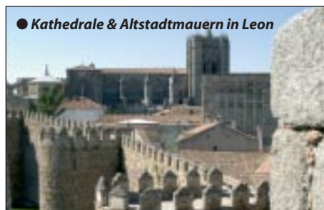
● Kathedrale & Altstadtmauern in Leon

Frühstück, danach fahren wir über die Puente la Reina, der schönsten Brücke am Jakobsweg, und Estella, dem "Toledo des Nordens", mit seinem Palast der Könige von Navarra. Auf der Pilgerstraße geht es nach Logroño mit großem Franziskanerkloster. Weiter geht die Fahrt durch die fruchtbare Landschaft nach Santo Domingo de la Calzada. Das Städtchen geht auf die Einsiedelei des heiligen Domingo zurück, der hier eine Steinbrücke über den Rio Oja, eine Pilgerherberge und eine Kirche baute. Heutiges Etappenziel ist die Stadt Burgos, mit seiner Kathedrale Santa Maria und der eindrucksvollen Innenausstattung. Kurzbesichtigung (Eintritt € 2,-). Halbpension.