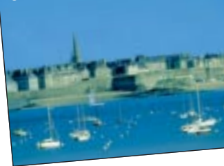
● Blick vom Meer auf St. Malo

Wir stärken uns nochmals beim Frühstücksbuffet und erreichen gegen 8 h morgens Rotterdam in Holland. Danach geht es in angenehmen Etappen durch Deutschland und über Eisenach zurück nach Sachsen, wo wir am späten Abend ein treffen.