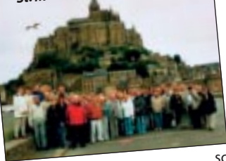
● Dietrichgruppe am Mont St. Michel

und ihrer Festungsanlagen ist sie einer der meistbesuchten Touristenorte Frankreichs. Weiterfahrt zum Cap Fréhel, dessen Klippen aus rosafarbenem Granit bestehen und bis zu 70 m steil zum Wasser hin abfallen. Am Spätnachmittag gehen wir in Roscoff an Bord unserer irischen Fähre mit Kabinenbezug, Schiffsabendessen und Bordübernachtung.