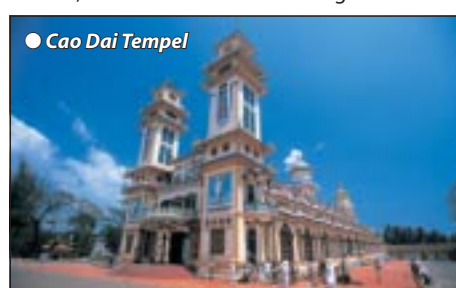
● Cao Dai Tempel

Morgens Weiterfahrt nach Saigon mit Unter- wegstopps in verschiedenen Dörfern, wo wir Handwerkskunst der Cham-Kultur sehen. Am Abend Bezug unseres Hotels für die nächsten 3 Nächte, Abendessen/Übernachtung.