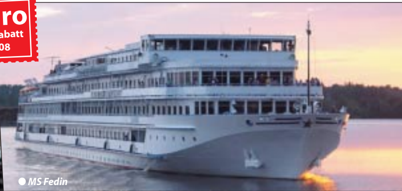
● MS Fedin