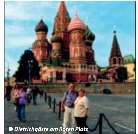
● Dietrichgäste am Roten Platz