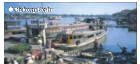
● Mekong Delta

Tagesausflug in das Mekong-Delta, einer amphi- bischen Welt mit vielen Ufern der unzähligen Kanäle und Flüsse und das drittgrößte Mün- dungsgebiet der Welt. Schifffahrt auf die Obstins- sel (Thoi Son), wir besichtigen eine Bienenfarm und erleben die Produktion von Kokosnuss-Sü- ßigkeiten. Nach dem Mittagessen durchqueren wir mit kleinen Sampanbooten den Fluss mit sei- nen vielen Inseln, Übernachtung Saigon