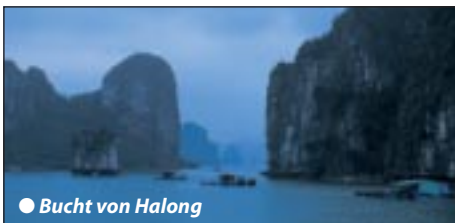
● Bucht von Halong

Stadtbesichtigung mit Ho Chi Minh Mausoleum, das „Haus auf Stelzen“ und die historische Ein- baumpagode, aus nur einem Baumstamm errich- tet. Anschließend Besuch der Tran Quoc Pagode und Mittagessen. Bustransfer zum Weltnaturerbe Halong-Bucht, der „Bucht des untertauchenden Drachen“. Übernachtung Halong.