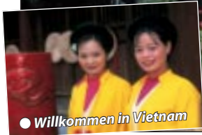
● Willkommen in Vietnam