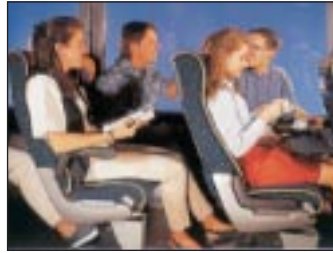
● Unser beliebter Bordservice: „Darfs noch ein Abschiedsobstler sein?“

Ausgesuchte Hotels mit Atmosphäre und Stil zeichnen Dietrich-Rundreisen und Urlaube aus. Erstklasshäuser mit Fitnessseinrichtungen, Hallenbäder und Unterhaltungsmöglichkeiten. Durch ein aufwendiges Prüfverfahren werden diese ausgewählt und entsprechen dadurch unserem Qualitätsniveau.