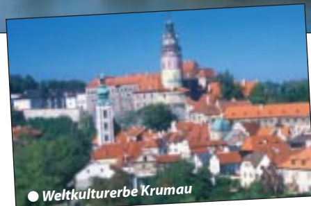
● Weltkulturerbe Krumau