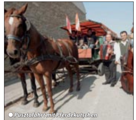
● Pusztafahrt mit Pferdekutschen

Frühstück im Hotel, danach Kofferverladung und um 9.30 h Rückfahrt in angenehmen Etappen über die Westautobahn und allfälliger Unterwegsbesichtigung nach Tirol.