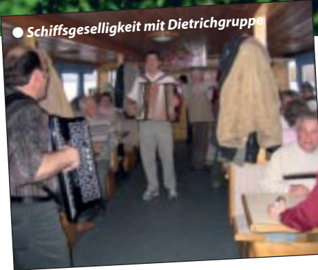
● Schiffsgeselligkeit mit Dietrichgruppe

sen. Um 15 h Stadtrundgang durch Rust mit Weinbergführung und Weinverkostung (3 Sorten) im alten Holzfasskeller. 19.00 h Abendessen im Hotel in Mörbisch.