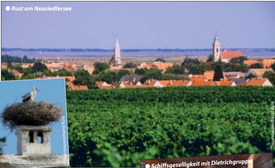
● Rust am Neusiedlersee

Burgenland Aktion Mörbisch in 4-Sternehotel mit Hallenbad inklusive Vollpension, Naturparkwanderungen, Schiffsparty, Ausflügen und Wien mit Schönbrunner Tiergarten