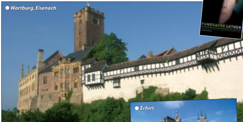
● Wartburg, Eisenach

WARTBURG - EISLEBEN - LUTHERSTADT WITTENBERG - ERFURT Auf den Spuren des Reformators mit historischem Altstadtfest oder Ausstellung „Fundsache Luther“