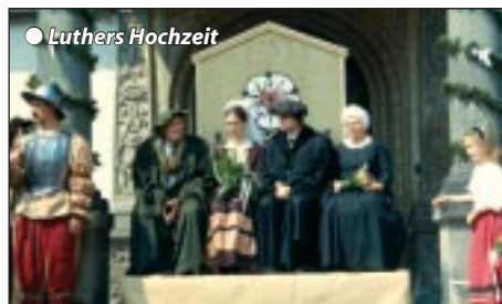
● Luthers Hochzeit

3. Tag: Halle - Erfurt - Heimreise Tirol Frühstücksbuffet, danach Fahrt von Halle nach Erfurt, eine eindrucksvolle historische Stadt mit dem monumentalen Ensemble des Mariendoms und der Severinkirche. Stadtführung durch die bestens erhaltene mittelalterliche Altstadt mit ihrer berühmten Krämerbrücke. Erfurt, die geistige Heimat des Reformators, hat reiche Tradition als Luther-, Dom- und Universitätsstadt, hier wird auch das Schutzpatron & Martinsfest gefeiert. Mittags Rückfahrt in südliche Richtung über Bayern mit Verabschiedungsimbiss unterwegs nach Tirol.