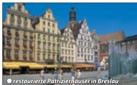
restaurierte Patrizierhäuser in Breslau

Frühstück, danach Innenstadtfahrt und halbtägige Stadtbesichtigung mit Spezialführer. Es erwarten uns unzählige Sehenswürdigkeiten und Backsteingotik deutschen Ursprungs. Wir besuchen den Marktplatz mit dem Rathaus und Häu-