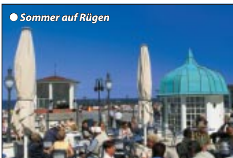
● Sommer auf Rügen

1. + 2.Tag: Tirol - Sachsen - Stralsund - Rügen Abfahrt vormittags in Telfs mit weiteren Zusteigstellen über München und mit angenehmer Unterwegsbesichtigung nach Mitteldeutschland. Am Spätnachmittag erreichen wir unser Etappenziel Chemnitz, Zwischenübernachtung Abendessen auf eigene Faust. Zeitig am nächsten Morgen geht es weiter über Dresden, vorbei an Berlin nach Mecklenburg. Nach einem kleinen Unterwegsimbiss treffen wir am frühen Nachmittag in Stralsund an der Ostseeküste ein. Danach geführte Stadtrundfahrt mit Rundgang durch die Altstadt (UNESCO-Weltkulturerbe). Sie ist mit ihren gotischen Kirchen, schönen Giebelhäusern, Klöstern, Stadtmauern und Türmen ein beeindruckendes Zeugnis Jahrhunderte alter hanseatischer Baukunst. Nach etwas Freizeit geht es über die neue Rügenbrücke auf die Insel Rügen nach Sassnitz. Begrüßungsgetränk und Bezug unseres Standorthotels für die nächsten 3 Nächte. Gelegenheit die hoteleigene Rügenterme zu benutzen, Halbpension.