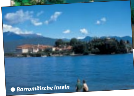
● Borromäische Inseln