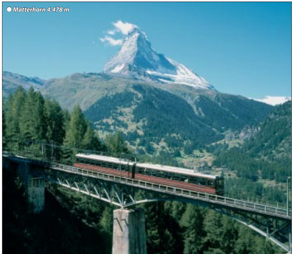
○ Matterhorn 4.478 m

Heute erleben wir den absoluten Höhepunkt der Schweiz, den weltberühmten Bergsteigerort am Fuß des imposanten Matterhorns während eines Rundgangs mit seinen malerischen Holzhäusern, Bergsteigermuseum, eleganten Läden und vielen Hotels. Freizeit und Gelegenheit zur Auffahrt mit der Zahnradbahn (ca. € 47,- hin + ret.) aufs Gornegrat, von wo wir einen atemberaubenden Panoramablick auf den König der Berge, das Matterhorn genießen. Abendessen und Übernachtung in Zermatt.