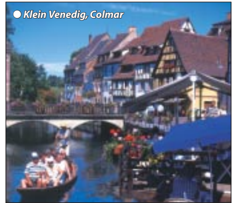
● Klein Venedig, Colmar

Aktionsreise „Bugatti Royal und Colmar, Weinstraße, Mulhouse