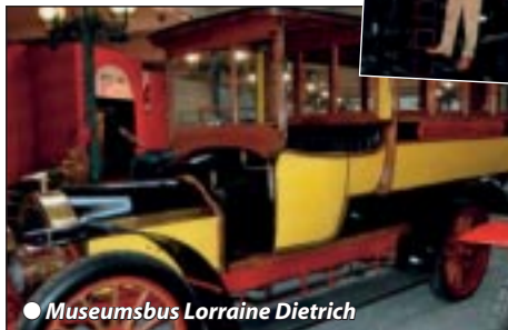
● Museumsbus Lorraine Dietrich

Zeitiges Hotelfrühstück, anschließend geführte Stadtbesichtigung in Mulhouse mit ihren unzähligen Zeitzeugen industrieller Geschichte. Anschließend besuchen wir das weltberühmte Automuseum der ehemaligen Industriellenbrüder Schlumpf mit der weltgrößten Oldtimersammlung und historischen Autoraritäten wie Bugattis und Rolls Royce. Der nächste Museumsbesuch zeigt 150 Jahre Eisenbahngeschichte mit beeindruckenden Exponaten, Waggons, Lokomotiven und Utensilien. Am frühen Nachmittag heißt es Abschied nehmen und wir fahren in angenehmen Etappen durch die Schweiz mit Unterwegspausen wieder zurück nach Tirol.