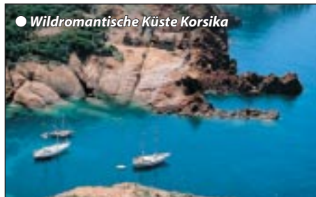
● Wildromantische Küste Korsika

Nach dem Frühstück wunderschöne Fahrt am Fuße des Esterelgebirges und entlang der „Blauen Küste“ mit ihren traumhaften Badestränden und dem Farbenkontrast zwischen türkischem Meer und dem rosa Porphyrt des Gebirges. Besonders reizvoll ist unser Aufenthalt im Künstlerstädtchen St. Tropez mit seinem Yachthafen. Nachmittags geht's durch Korkeichenwälder mit wechselnden Düften und bunter Mittelmeermaçchia in das typische und romantische Provencendorf Bormes mit etwas Freizeit. Tagesziel ist die Hafenstadt Toulon. Stadtbummel zu den Sehenswürdigkeiten wie Belle Epoque Opernhaus, Skulpturenbrunnen oder Sie nehmen sich Zeit, am Hafen einen „Cafe au lait“ zu trinken. Gegen 19 h Einschiffung auf unsere Komfortfähre mit Bordabendessen. Die stimmungsvolle Hafenausfahrt gegen 21 h sollten wir nicht versäumen, Kabinenübernachtung.