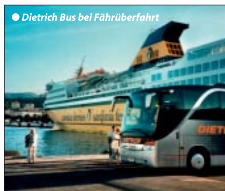
● Dietrich Bus bei Fähriüberfahrt

Frühstück im Hotel, danach entdecken wir mit einem Spezialführer die Welt der Stars, Sternchen und viel Prominenz bei einem Stadtpaziergang durch Cannes mit seinen Sehenswürdigkeiten wie Altstadt, Schloss, Filmpalast, Casino uvm. Mittags gemeinsame Bootsfahrt zu den vorgelagerten Inseln Sainte Marguerite, witterungsbedingt allenfalls ersatzweise eine Minizugrundfahrt. Nachmittags Bummelfreizeit in Cannes mit Möglichkeit zum Kaffeetrinken an der Palmenpromenade. Abendmenü mit Käse und Kaffee, Übernachtung. (Ruhetag für den Bus)