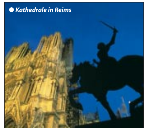
● Kathedrale in Reims

Frühstück, danach verlassen wir Frankreich und kommen wieder ins Saarland. In angenehmen Etappen geht es vorbei an Heidelberg nach Ansbach/Nürnberg. Nach einer allfälligen Umstiegs-pause mit kleinem Unterwegssnack fahren wir wieder zurück nach Tirol, eine eindrucksvolle Erlebnisreise mit Kunst und Kultureindrücken geht zu Ende.