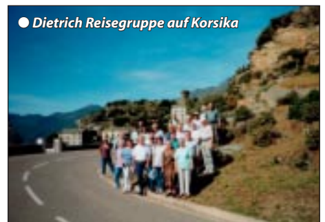
● Dietrich Reisegruppe auf Korsika

Nach einem zeitigen Frühstück fahren wir zum Hafen, wo wir mit einer angenehmen Tages-See-reise Korsika gegen 8.15 h morgens verlassen. An Bord Gelegenheit, die unzähligen schönen Eindrücke Revue passieren zu lassen und sich am Sonnendeck auszuruhen. Wir erreichen mittags Livorno in Italien und setzen unsere Komfortbusreise Richtung Norditalien fort. Am Gardasee genießen wir nochmals angenehme Bummelfreizeit in südlichem Flair, bevor wir abends wieder in Tirol eintreffen.