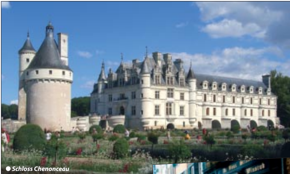
● Schloss Chenonceau

Faszinierende Frankreich Rundreise zu den herrlichsten Schlössern und Natur im Loiretal Höhepunkte: Seine metropole Paris, Burgund, Champagne, Kathedralen und Schlösser