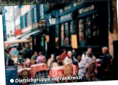
● Dietrichgruppe in Frankreich

Nach dem Frühstück gemeinsamer, kurzer Spaziergang durch das historische Zentrum von Dijon, eine der sehenswerten Kunststädte Frankreichs. Weiterfahrt durchs Weinland Burgund über Auxerre in die alte Königsstadt Orléans, berühmt durch die Jungfrau von Orléans. Kurzbesuch der mächtigen Kathedrale und des Altstadtviertels. Weiterfahrt entlang der Loire zum ersten unserer Schlösser, Chambord, einem riesigen Märchenpalast und einem der schönsten Renaissance Schlösser der Erde mit Außenbesichtigung und Fotostopp. Dem Verlauf der Loire folgend erreichen wir die Königsstadt Blois mit ihrem sehenswerten Schloss direkt am Fluss. Etappenziel ist Tours, wo wir unser zentrales Hotel für die nächsten beiden Nächte beziehen. Abendessen und Übernachtung.