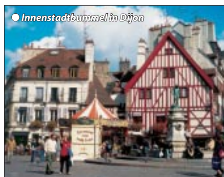
● Innenstadtbummel in Dijon

Abfahrt 5.20 h Innsbruck mit weiteren Zusteigstellen geht es auf herrlicher Alpenroute durch die Schweiz vorbei am Walen- und Zürichsee. Bei Basel kommen wir nach Frankreich und besuchen als erstes Belfort, die alte Festungsstadt am Eingang der burgundischen Pforte. Tagesziel ist Dijon, die Burgunderhauptstadt am Fuße der Hügelkette Côte d'Or. Bezug unseres zentrumsnahen Hotels mit Möglichkeit zum eigenen Stadtspaziergang. Abendessen/Übernachtung.