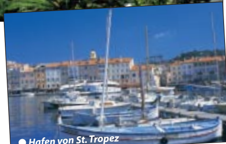
● Hafen von St. Tropez