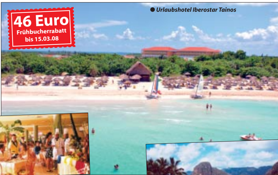
● Urlaubshotel Iberostar Tainos

Karibisches Inselerlebnis „Entdecken & Erholen“ mit Flug ab Innsbruck und All Inklusivleistungen. 5 Tage Rundreise „Tabak und Rum“ inklusive Vollpension & 10 Tage Firstklass All-Inklusive Strandurlaub