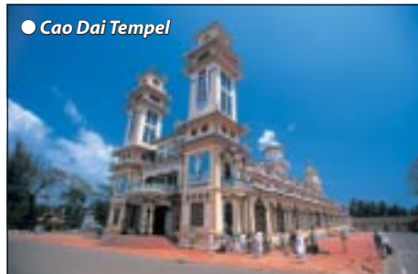
● Cao Dai Tempel

Morgens Weiterfahrt nach Saigon mit Unterwegsstops in verschiedenen Dörfern, wo wir Handwerkskunst der Cham-Kultur sehen. Am Abend Bezug unseres Hotels für die nächsten 3 Nächte, Abendessen/Übernachtung.