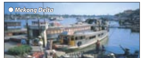
● Mekong Delta

Tagesausflug in das Mekong-Delta, einer amphibischen Welt mit vielen Ufern der unzähligen Kanäle und Flüsse und das drittgrößte Mündungsgebiet der Welt. Schifffahrt auf die Obstinzel (Thoi Son), wir besichtigen eine Bienenfarm und erleben die Produktion von Kokosnuss-Süßigkeiten. Nach dem Mittagessen durchqueren wir mit kleinen Sampanbooten den Fluss mit seinen vielen Inseln, Übernachtung Saigon