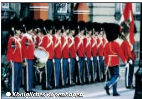
● Königliches Kopenhagen

Abfahrt 8 h Innsbruck und Telfs nach Bayern. In angenehmer Fahrt erreichen wir am Nachmittag Mitteldeutschland mit Etappenziel im Raum Chemnitz. Abendessen und Zwischenübernachtung. Nach einem zeitigen Frühstücksbuffet geht es am nächsten Morgen weiter über Leipzig nach Schwerin, der norddeutschen Landeshauptstadt. Kurzer Zentrumsaufenthalt am Schloss und am See, danach Weiterfahrt in die Hansestadt Lübeck. Hotelbezug und gemeinsamer Innenstadtbummel mit Holstentor. Abendessen/Übernachtung.