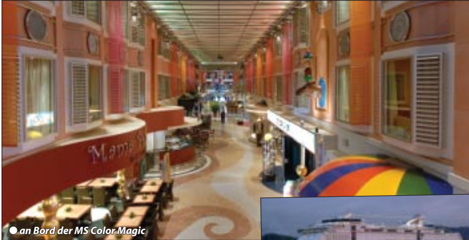
● an Bord der MS Color Magic

Feiertags-Nordland Erlebnistour im Kreuzfahrtambiente mit neuem MS Color Magic Schiff