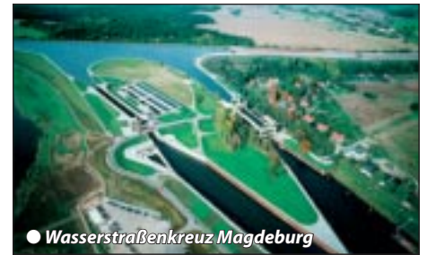
● Wasserstraßenkreuz Magdeburg

Frühstücksbuffet und geführter Besichtigungsrundgang durch Magdeburg mit ihrem imposanten Dom und 1200 Jahre wechselvoller Geschichte. Besuchshöhepunkt ist das 1999 fertiggestellte größte Wasserstraßenkreuz Europas, das den Mittellandkanal mit der Elbe verbindet. Am Spätmittag Rückfahrt in angenehmen Etappen über Leipzig und Kurzbesuch in der Wagnerstadt Bayreuth zurück nach Tirol.