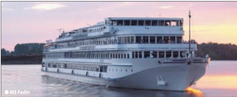
● MS Fedin