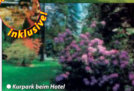
● Kurpark beim Hotel

Günstig und gut sind unsere beliebten Gesundheitsreisen ins Thermalbad Topolsica. Das milde Klima auf der Alpensüdseite ist geradezu ideal, etwas „Gesundheit“ inmitten unberührter Natur zu tanken. Die Heilquelle mit 32 Grad Wärme eignet sich vor allem zur Behandlung von Rheuma und Gefäßerkrankungen. Eine äußerst preiswerte Möglichkeit für Gesundheitsferien in einer Hotelanlage, wo Therapie und Bäder - unter einem Dach sind!