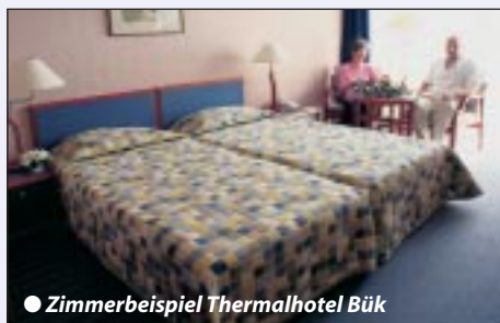
● Zimmerbeispiel Thermalhotel Bük

Ein kleiner, idyllischer Ort und eines der bedeutendsten Heilbäder Ungarns. Ca. 25 km von der österreichischen Grenze entfernt bietet dieser Kurort Ruhe und Entspannung. Im nahegelegenen Dorf befinden sich typisch ungarische Csardas-Gaststätten, ein Kultur-Zentrum sowie eine Ladenstraße mit vielen Geschäften.