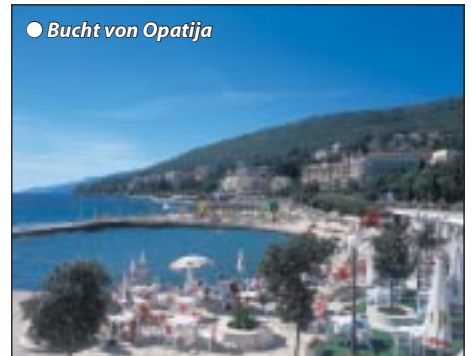
● Bucht von Opatija